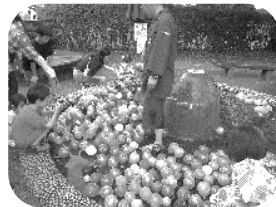
噴水池でヨーヨー釣り！