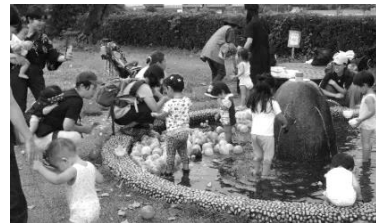
にぎやかに今年最後の噴水遊び

来年の夏も、たくさんの子どもたちが遊びに来てくれることを願って、噴水はしばらくお休みとなります。