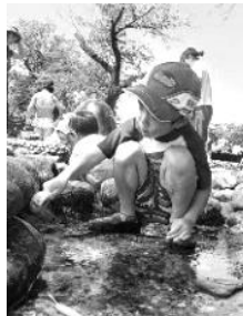
水路の壁面も念入りに