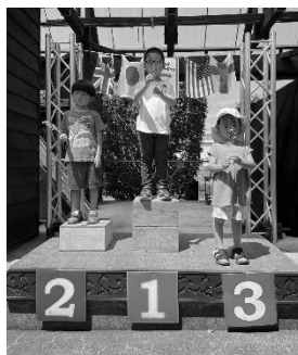
ダンゴリンピックのメダリストたち☆

パリ五輪が開幕した翌日の7月27日(土)、アミーゴでは「LOVE♡ ダンゴムシ きみに夢虫！」を開催。ダンゴムシ好きの