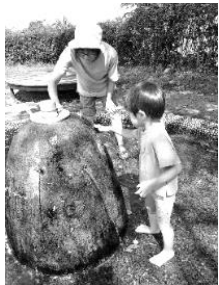
タワシ片手に、お母さんと一緒にゴシゴシ

夏の間、大人気のアミーゴ噴水(通称:ジャブジャブ池)。「この暑い夏、どれだけアミーゴの噴水に助けられたか」との声も届き、近隣の親子連れにとってこの噴水の存在は絶大のようです。そんな中、館庭を「外遊び」の場所として利用する「子育て支援センターあん」より、噴水の掃除をしてくださるとい嬉しい連絡が。9月9日(月)に利用者親子の皆さんでお掃除をしていただきました！