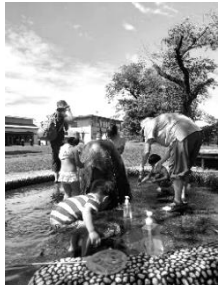
熱心に作業します